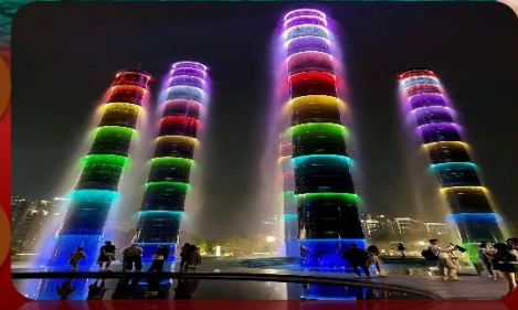
ห้าง SKP ไฟเรืองแสง