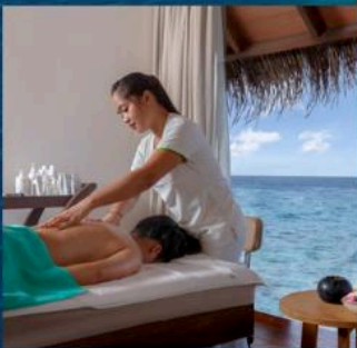
SPA 30 Mins