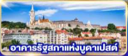
อาคารรัฐสภาแห่งบูดาเปสต์