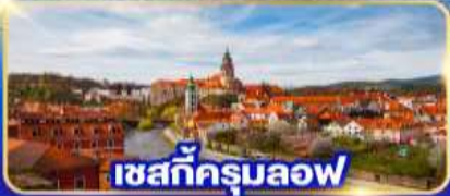
เซสท์ครุมลอฟ