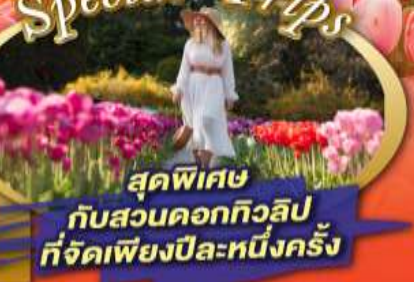
สุดพิเศษ กับสวนดอกทิวลิป ที่จัดเพียงปีละหนึ่งครั้ง