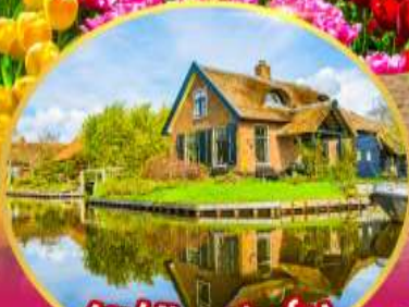
หมู่บ้านที่รูรัม