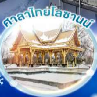
ศาลาไทยโหลซานบ้