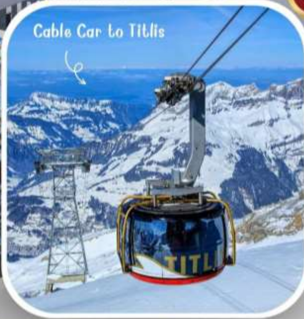
Cable Car to Titlis