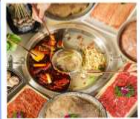
หม้อไฟหมาล่า