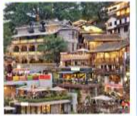
ตรอกโบราณเซี่ยฮ่าวหลี่