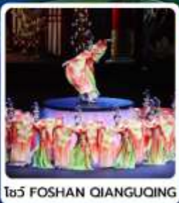
โธว FOSHAN QIANGUOING