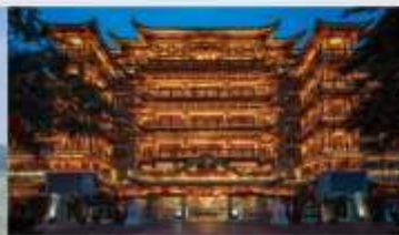
วัดต้าฝ่อซื่อ