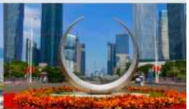
จัตุรัสฮิวเจิง

*ทางบริษัทฯ ขอสงวนสิทธิ์ในการสับโปรแกรมทัวร์ตามความเหมาะสมขึ้นอยู่กับสถานการณ์ประจำวัน โดยคำนึงถึงผลประโยชน์ของลูกค้าเป็นสำคัญ