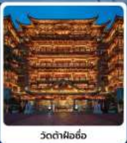
วัดต้าผือซือ