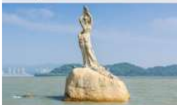
จูไห่พีชเชอร์เกิร์ล(หัวหินี่)