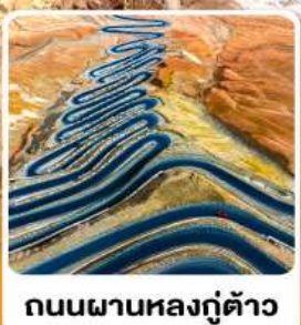
ถนนผานหลงตู้ต้าว