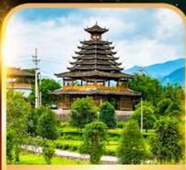
หมู่บ้านชนเผ่าตัง