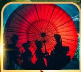
ชมแสงสีท่าเกิงหลง