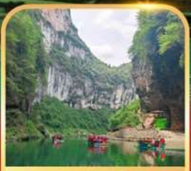
อุทยานจินหลีซาน