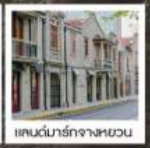
แลนด์มาร์กจางหยวน

เซี่ยงไฮ้ คคลาศสิก ไนท์ / 3 ดึกใหญ่แห่งเซี่ยงไฮ้ คองเรือหมู่บ้านโบราณจูเจียเจียว / EKA Tianwu / วัดหลงหัว แลนด์มาร์ก จางหยวน / ถนนหวยไห่ / ชมโชว์ ERA ที่โรงละครโด่งดังระดับโลก / ซินเทียนตี้