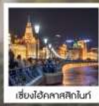
เซี่ยงไฮ้ คคลาศสิกไนท์