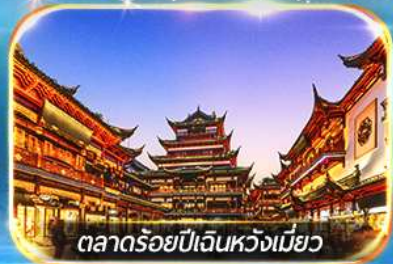
ตลาดร้อยปีเงินหวงเมียว

ถ่ายรูปชมสวนนอร์มัลด์ , เขคอินหาดไว่ทาน, วัดพระหยกขาว อิสระช้อปปิ้งถนนนานกิง POPMART FLAGSHIP STORE