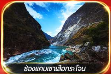
ช่องแคบเขาเสือกระโจน