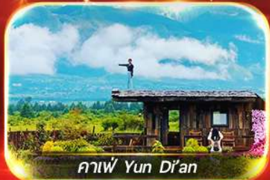
กาแฟ Yun Di'an

นั่งรถไฟชมวิว "ภูเขาหิมะมังกรหยก", ชมสวนดอกไม้ตามฤดูกาล ชมโชว์สุดอลังการ IMPRESSION LIJIANG, ถ่ายรูปกับคาเฟ่ยอดฮิต