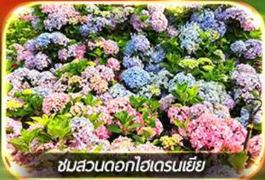
ชมสวนดอกไม้ไฮดรันเจีย