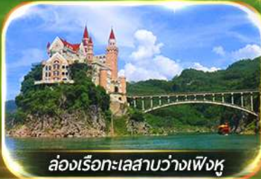
ล่องเรือทะเลสาบว่างเฟิงหู