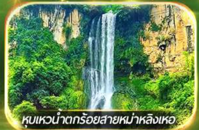
ชมเขื่อนน้ำตกร้อยสายหม่าหลิงเหอ

ชมป่าภูเขาหมื่นยอด, เที่ยวหมู่บ้านโบราณหลินปู้อี ล่องเรือทะเลสาบว่างเฟิงหู, ชมสวนดอกไม้ตามฤดูกาล