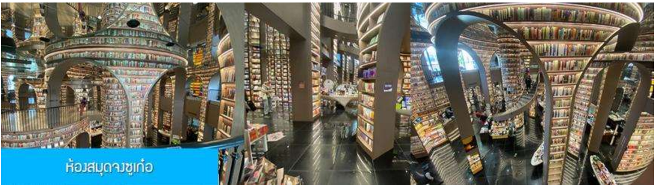
ห้องสมุดจวงซูเก้อ

พักที่ โรงแรม CENTER INTER HOTEL ระดับ 4 ดาวท้องถิ่นหรือเทียบเท่าในเมืองจูเจียงเย็น