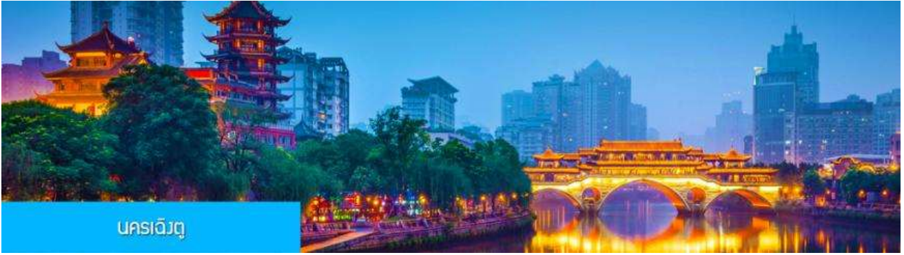
นครเฉิงตู