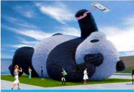
ตุ๊กตาแพนด้าอนเซลฟ์