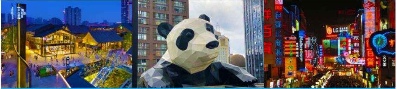
ถนนไท่กู่หลี่ และวัดต้าฉือ