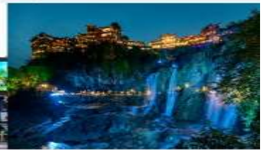
ฟูหรงเจิน

*ทางบริษัทฯ ขอสงวนสิทธิ์ในการสลับโปรแกรมทัวร์ตามความเหมาะสมขึ้นอยู่กับสถานการณ์หน้างาน โดยคำนึงถึงผลประโยชน์ของลูกค้าเป็นสำคัญ