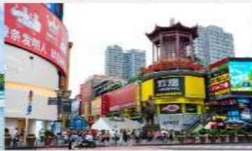
ถนนหวงซิงลู่