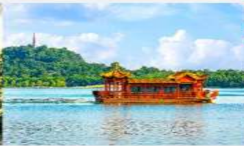
ล่องเรือทะเลสาบหลิวเยว่หู