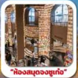
"ห้องสมุดจงซูเก๋"