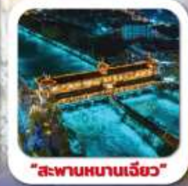
"สะพานหมานเฉียว"