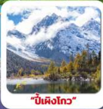
"ปี้เผิงโกว"

ชมความงาม 2 อุทยาน • สี่ฤดูนี้ อว่งเฉียวโกว • ปี้เผิงโกว • พระใหญ่เล่อซาน สะพานหมานเฉียว น้ำตาสีฟ้า • ห้องสมุดสุดเก๋ จงซูเก๋ • แพนด้ายักษ์บนจอมเขาสี ชอยกัวจางชอยแคม • ถนนคนเดินซุนซีสู๋ • แพนด้ายักษ์ปีนดึก • ถนนคนเดินจินหลี่