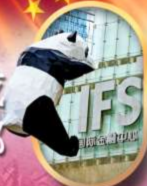
IFS หนีแพนด้าป็นตึก