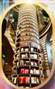
หอหนังสือจงซูเก้อ