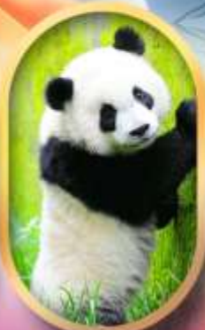
ศูนย์อนุรักษ์หนีแพนด้า