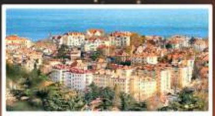
จุดชมวิว Signal Hill Park