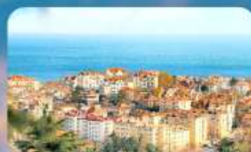
จุดชมวิว Signal Hill Park