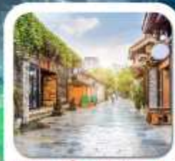
"ชอยกวางชอยแคม"