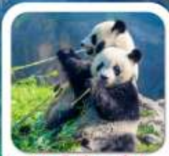
"สุนย์หมีแพนด้า"