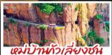
หมู่บ้านทิวเสี่ยงซุน