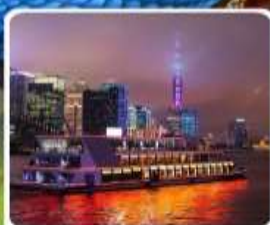
ส่องเรือแม่น้ำหวงผู่