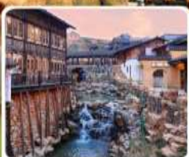
เมืองโบราณเหย้าหู