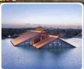
พิพิธภัณฑ์ไดน้ำกวางฟูหลิน