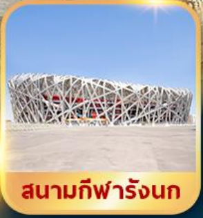
สนามกีฬารังนก