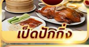
เป็ดปักกิ่ง