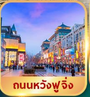
ถนนหวงฟู่จิ่ง