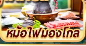
หม้อไฟมองโกล