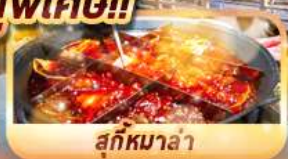
สุกั๊กมาล่า