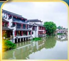
หมู่บ้านโบราณซีเป่า