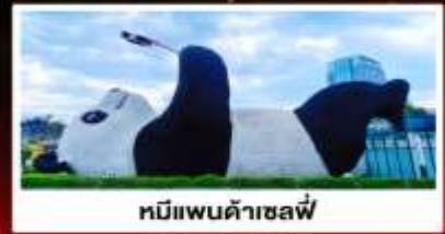
หมีแพนด้าเซลฟี