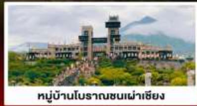
หมู่บ้านโบราณชนเผ่าเซียง