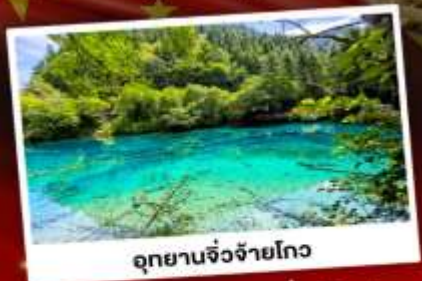
อุทยานจิ้งจายโกว

"เที่ยว 2 อุทยานสวรรค์" เที่ยวศูนย์อนุรักษ์หมีแพนด้าสุดน่ารัก