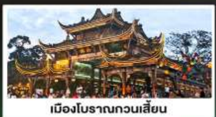
เมืองโบราณทวนเสียน