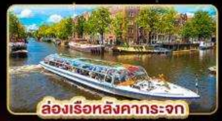
ล่องเรือหลังคากระจุก