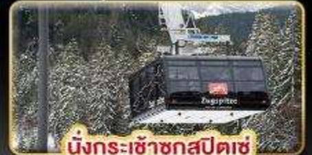
นั่งกระเช้าชุกสปีตซ์

มินุรุ Full Service น้ำหนักกระเป๋า 25 kg.