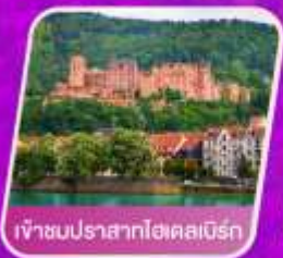
เจ้าชายนปราสาทไอศพลเบิร์ก

โรงแรม 4 ดาว อาหาร 14 มื้อ โทคน้ำเที่ยว น้ำหนัก 23 กก.