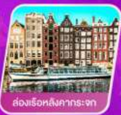
ล่องเรือหลังคากระซก