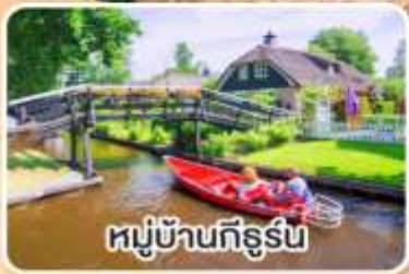
หมู่บ้านทีร์ูร์น