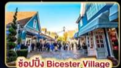
ช้อปปิ้ง Bicester Village