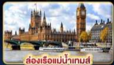
ล่องเรือแม่น้ำเทมส์