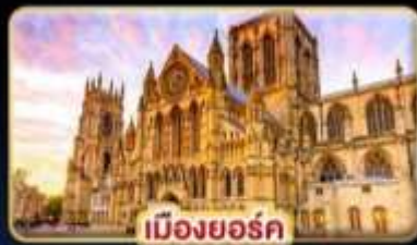
เมืองยอร์ก