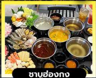
ซาบู่ฮ่องกง