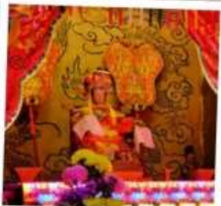
เจ้าแม่ทับทิม จอสเฮาส์เบย์