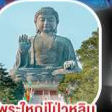
พระใหญ่ไผ่หลิน