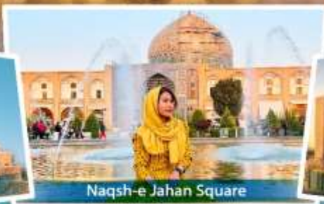
Naqsh-e Jahan Square