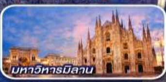
มหาวิหารมิลาน