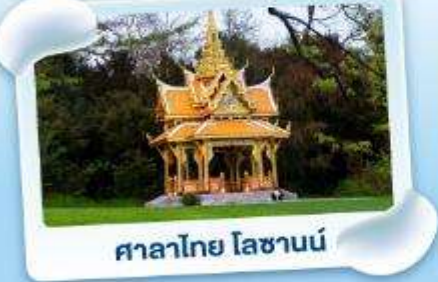
ศาลาไทย ไหลซานน์