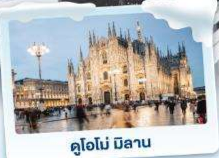
คูโอโม มิลาน