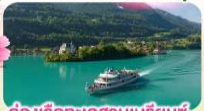
ล่องเรือทะเลสาบเบรียนซ์

พิชิตยอดเขาชุนเนกกา 1 ในเขาที่สวยงามที่สุดเมืองเซอร์แมท