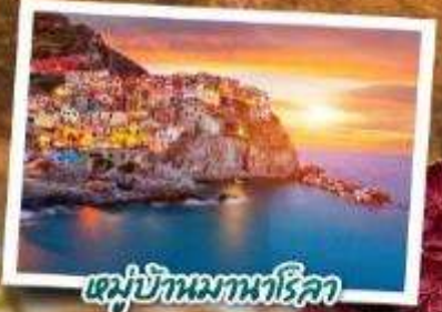
หมู่บ้านมหานรก