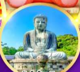
วัดโคโคคุอิน