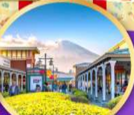
โกเทมบะ-พรีเมี่ยมเฮ้าส์