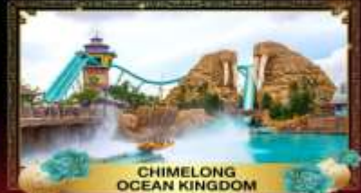
CHIMELONG OCEAN KINGDOM