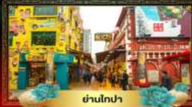
ย่านโกปา