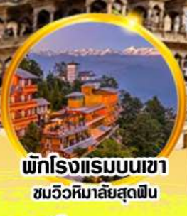
พักโรงแรมบนเขา ชมวิวหิมาลัยสุดฟิน