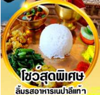
ไขว้สุดพิเศษ ลิ้มรสอาหารเนปาลแท้ๆ

ดินแดนศักดิ์สิทธิ์ที่แสงอันมกอดหิมาสัย สัมผัสสถาปัตยกรรมอันวิจิตรงดงาม กาฐมัณฑุ โทดรา ภัคตาบุร์ ปาทัน นากาทือต