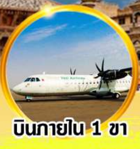
บินภายใน 1 ขา