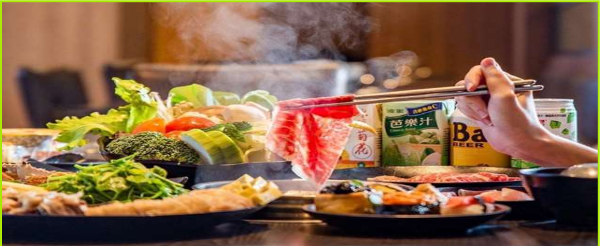
🍷 บริการอาหารค่ำ เมนูพิเศษ..ชาบู ชาบู บุฟเฟ่ต์เต็มอิม สไตส์ไต้หวัน