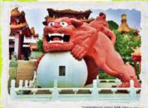
วัดเขวียนหวู