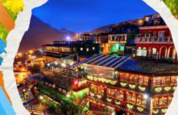
หมู่บ้านโบราณฉิวเฟิ่ง