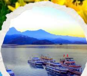
ทะเลสาบสุริยขึ้นจินทารา