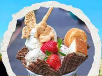
ร้าน ไอศกรีมมิยาฮาระ