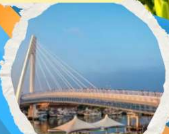
สะพานตงสู่ย