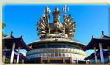
วัดกวงอิมหยวนเต้า