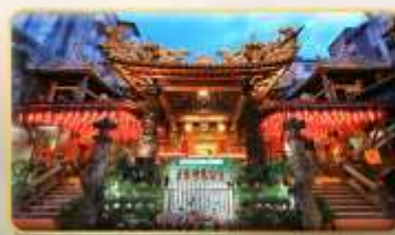
วัดเทียนโฮ่ว จอพรเจ้าแม่หม่าจู