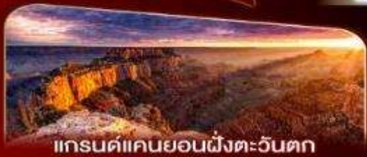
แกรนด์แคนยอนฝั่งตะวันตก