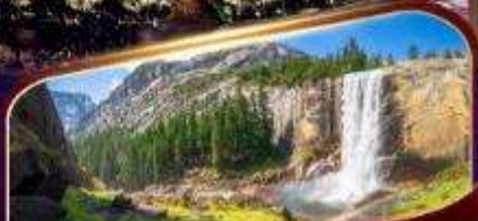
อุทยานแห่งชาติโยเซมิตี