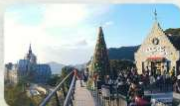
Gio Cafe Tam Dao