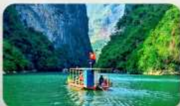
ล่องเรือ Ma Pi Leng Pass

YEN BIEN LUXURY 4* หรือเทียบเท่ามาตรฐานเวียดนาม