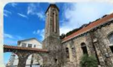
Tam Dao Stone Church