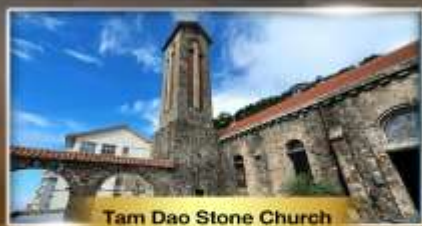
Tam Dao Stone Church