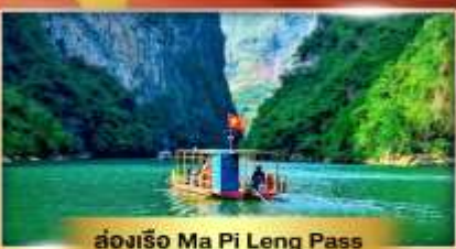
ส่องเรือ Ma Pi Leng Pass