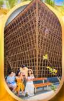
อาคารไม้ไผ่