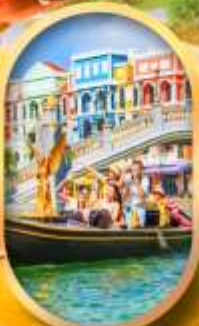
เวนิสแห่งเวียดนาม