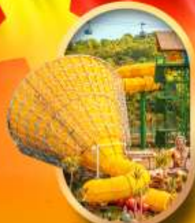
สวนน้ำ Hon Thom