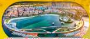
Kiss Bridge สะพานจูบ รวมค่าเข้าสะพานจูบแล้ว