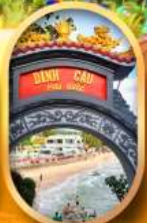
ศาลเจ้าดิงเกา