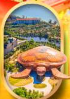
พิพิธภัณฑ์สัตว์น้ำ