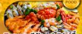
พิเศษเมนู ซิวคุดบุฟเฟ่ต์ 1 มื้อ เดินทาง มีนาคม 2569