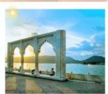
Ana Sagar Lake